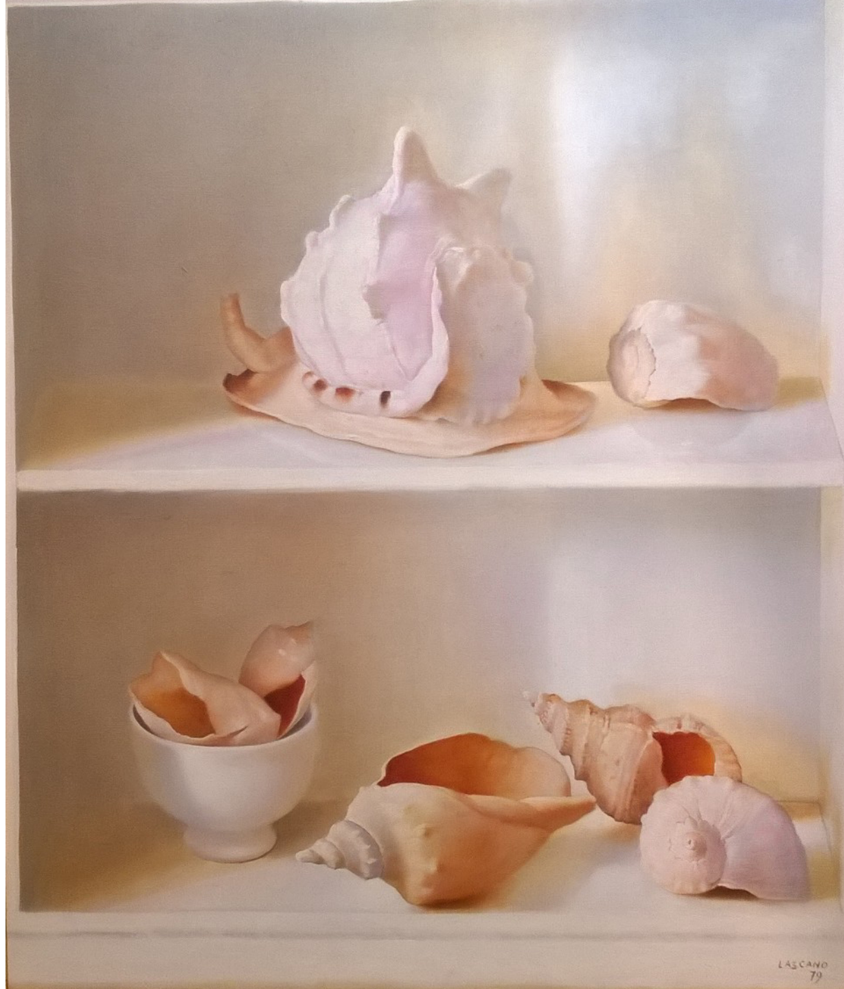
Juan LASCANO "Caracolas" Óleo sobre lienzo 1979 70 x 60 cm