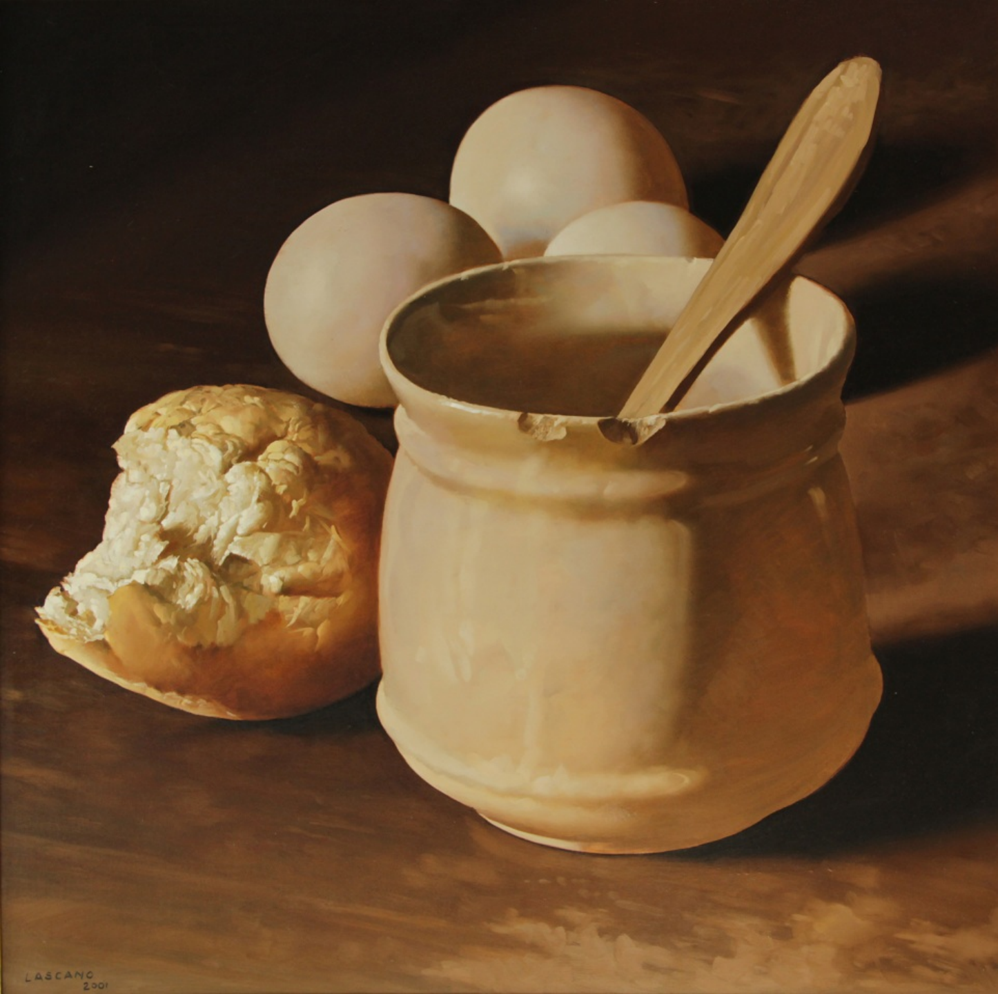
Juan LASCANO "Cena Monacal" Óleo sobre lienzo 2001 80 x 80 cm