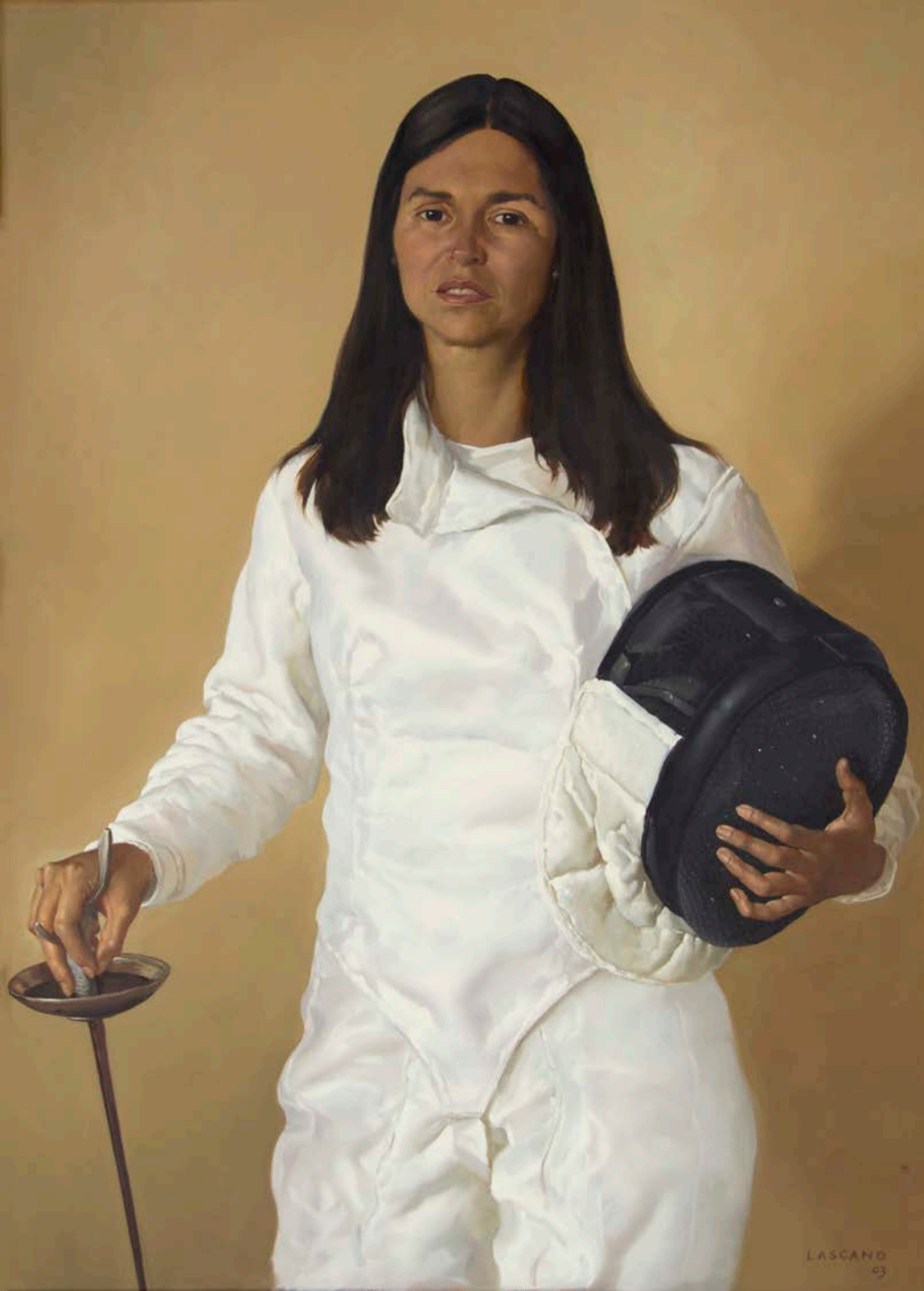
Juan LASCANO "Maite" Óleo sobre tabla 2003 100 x 70 cm