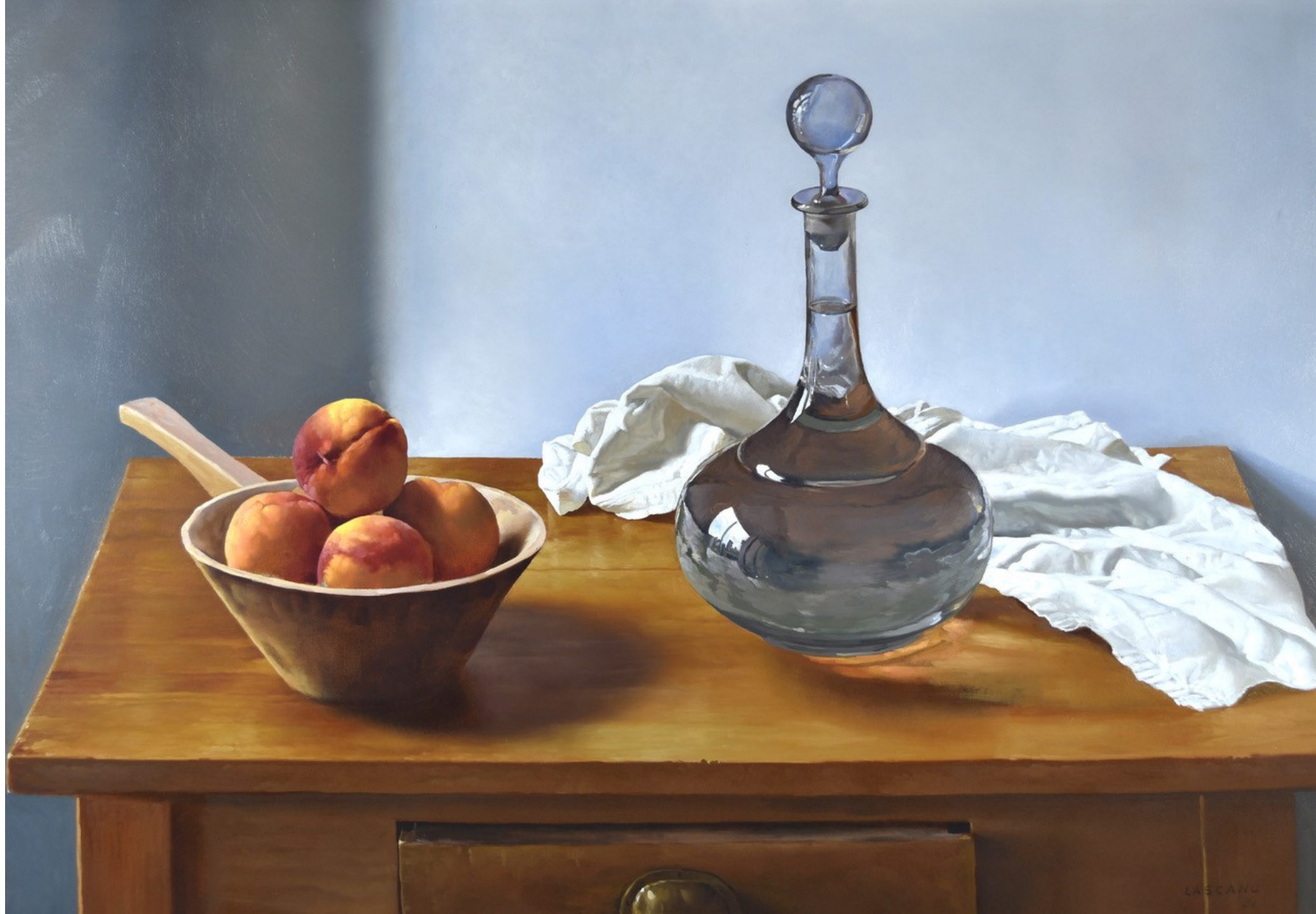
Juan LASCANO "Sinfonía de Luz" Óleo sobre lienzo 1991 70 x 100 cm